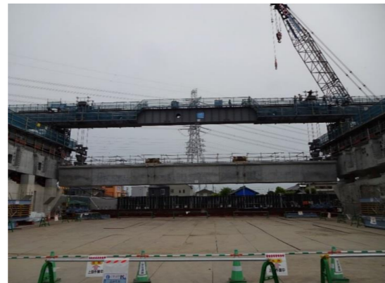
No. 7 D. 厚木第二高架橋(1)