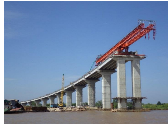
No. 4 W. ネアックルン橋