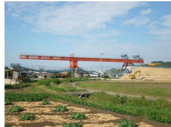
No. 5 N. 朝倉第二高架橋(1)