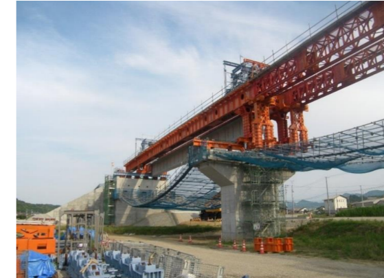
No. 6 N. 朝倉第二高架橋(2)