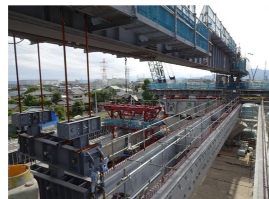
No. 8 D. 厚木第二高架橋(2)