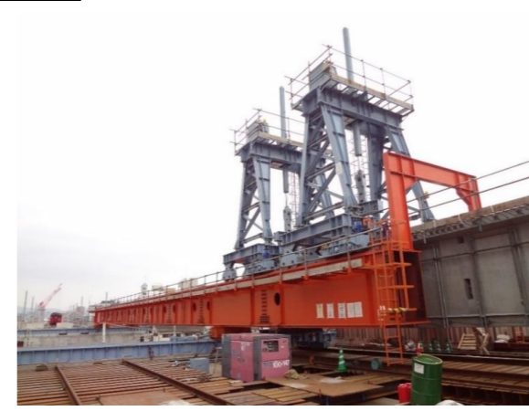
No. 3 F. 大分高架橋(2)