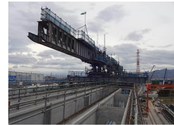
No. 1 D. 伊勢原高架橋