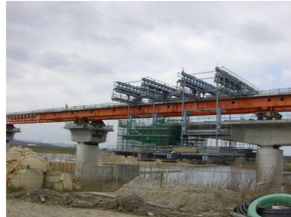
No. 1 A. 神戸堰橋