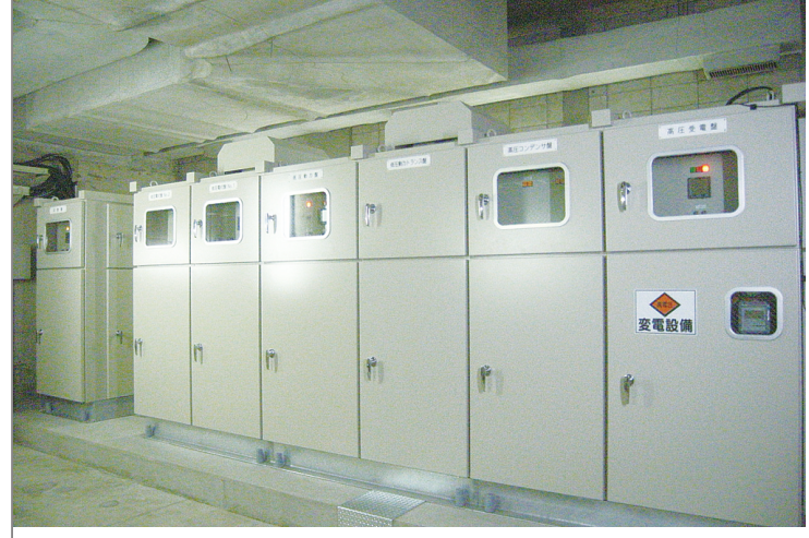
文化会館受変電設備更新工事

千葉県流山市平和台 4-78-10 TEL 04-7159-9000 FAX 04-7150-1010