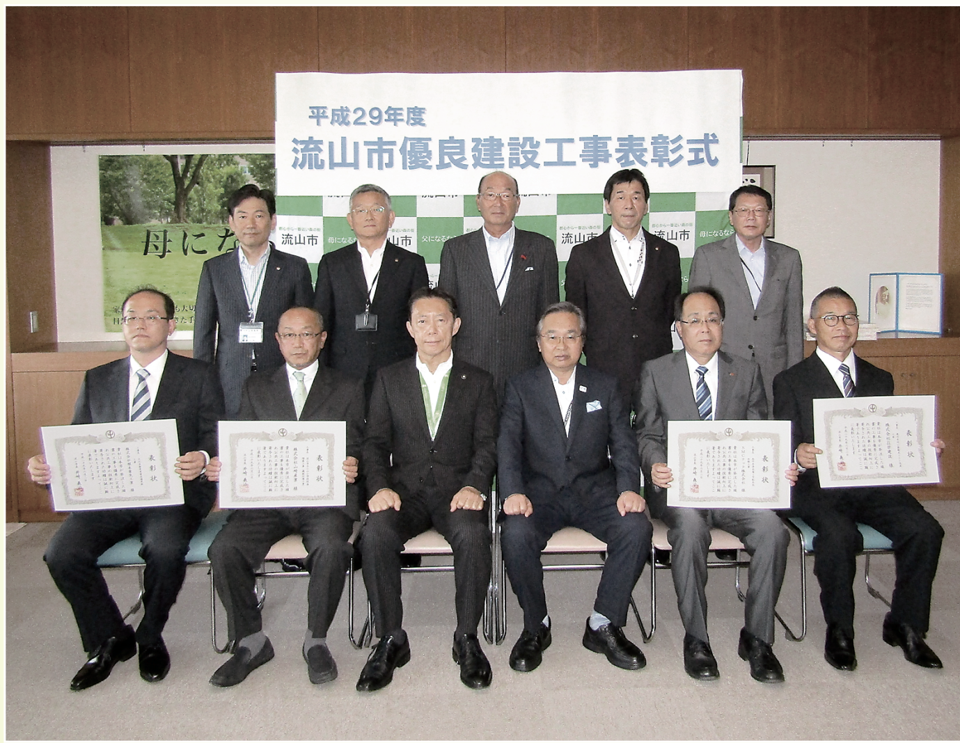
平成29年度 流山市優良建設工事表彰式

井崎義治市長は、受賞者らと受賞者の高い技術力をたたえた。表彰されたのは、建築一式工事で、流山市野々下3-954-3の計4社。表彰状を贈呈したあと、市長は祝辞を述べた。