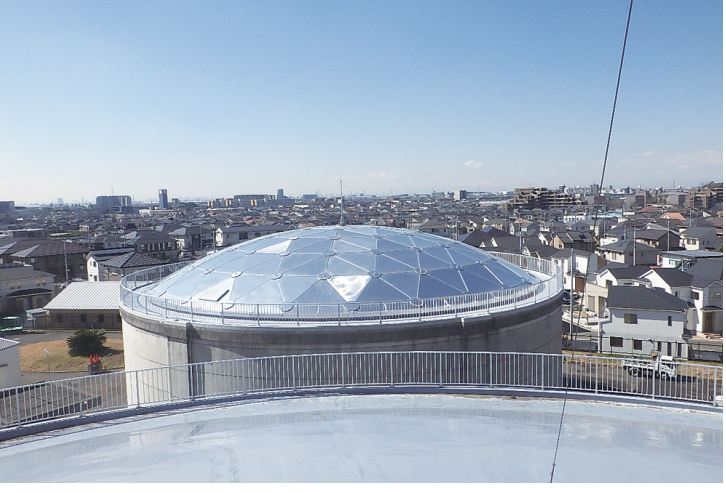
西平井浄水場1号配水池 改修工事

千葉県流山市鰯ヶ崎 3-4 TEL 04-7159-4131(代) FAX 04-7159-2871