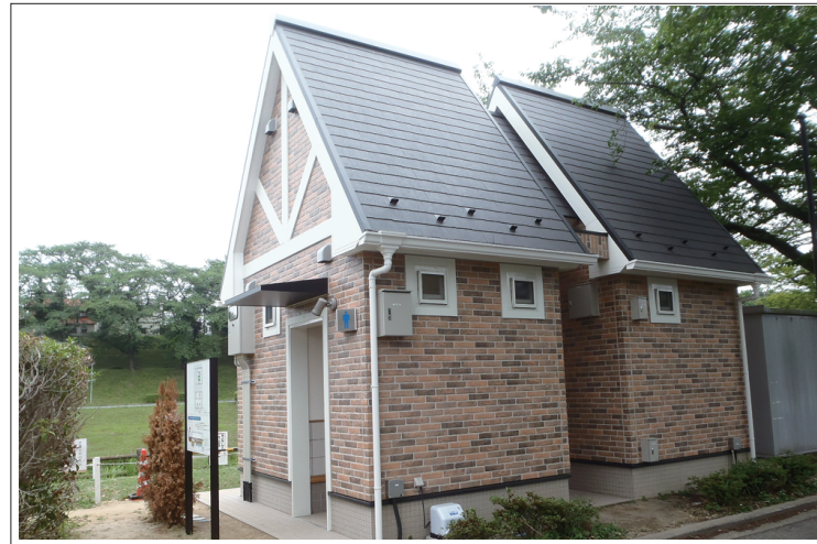
運河水辺公園 観光トイレ設置工事