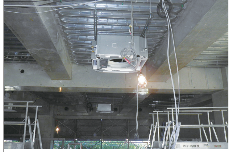
流山市立小山小学校校舎 増築工事(機械設備工事)

千葉県流山市野々下 3-954-3 TEL 04-7145-1634 FAX 04-7145-1614